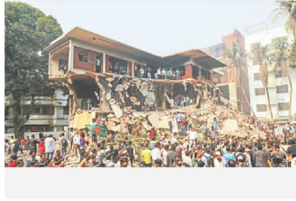
রাজশাহীর ধানমন্ডি ৩২ নম্বরে বেশ মুক্তিযুদ্ধের সময়ের পাড়িটি ভেঙে দেওয়া হয়েছে। গত বুধবার রাতে পাড়িটির সামনে জড়ো হন শিক্ষক জনতা। তারা আত্মরক্ষা করে এবং আগুন দেন। গতকালও পাড়িটিতে আগুন চলে। গতকাল দুপুর সাড়ে ১২টায়।

৫-৬ ফেব্রুয়ারি ২০২৫-এ “বুলডোজার মার্চ” কর্মসূচির অংশ হিসেবে মুক্তিযুদ্ধের গুরুত্বপূর্ণ স্থাপনা ধানমন্ডি ৩২ সম্পূর্ণরূপে গুঁড়িয়ে ফেলা হয়; ঘটনাস্থলে এনএসপি’র বহু নেতা উপস্থিত থেকে কাজটি তদারকি করে। ১৭ ফেব্রুয়ারি ২০২৫-এ গাজীপুরের কাপাসিয়ায় নিখোঁজের দুই দিন পর বীর মুক্তিযোদ্ধা গনি শেখের (৭০) মরদেহ উদ্ধার করা হয়। ২০ ফেব্রুয়ারি ২০২৫-এ কুমিল্লার গুণবতী ডিগ্রি কলেজের শহীদ মিনার রাতের আঁধারে ভেঙে ফেলা হয়; এছাড়াও শহীদ মিনার ভেঙ্গে ওয়াশরুম বানানো হয়েছে যশোরের মনিরামপুরে। শহীদ মিনার ভাঙ্গার তদন্ত ও বিচার প্রক্রিয়ার ব্যাপারে প্রশাসনের নীরবতা চোখে পড়ার মতো।