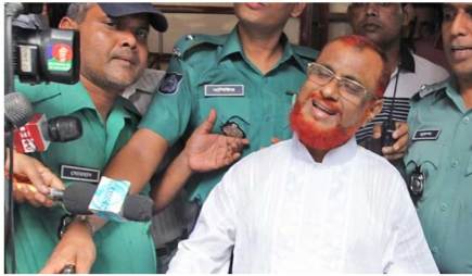
নিজস্ব প্রতিবেদক - বিভিন্নটিভি টোকেসিওনের উদ্দেশ্যে