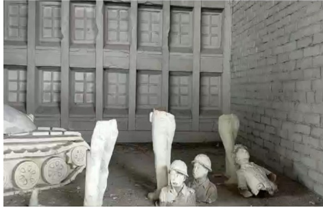
সেদিনের মুক্তিযুদ্ধ মুক্তিযুদ্ধ স্মৃতি স্মরণের পটভূমি

৬০০ মুক্তিযুদ্ধভিত্তিক ভাস্কর্য ভাংচুর করা হয়।