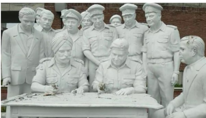
সেদিনের মুক্তিযুদ্ধ মুক্তিযুদ্ধ স্মৃতি স্মরণের পটভূমি

৫ আগস্ট মাননীয় প্রধানমন্ত্রী শেখ হাসিনার দেশত্যাগের পর সারাদেশে হত্যা, অগ্নিসংযোগ, ভাংচুরের উৎসব শুরু হয়। শুধু ৫ আগস্টেই সারাদেশে ভেসে ফেলা হয়েছে মুক্তিযুদ্ধের প্রায় সহস্রাধিক ভাস্কর্য ও স্থাপনা। ৫ আগস্ট দুপুরে মেহেরপুর মুক্তিযুদ্ধ জাদুঘরে হামলা করে প্রায়