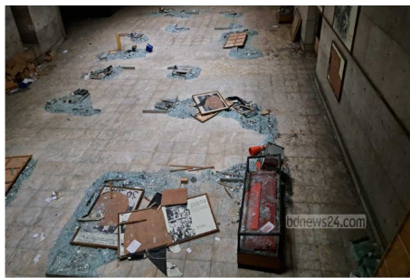
স্বাধীনতা জাদুঘরে নতুন স্মৃতি স্মরণের পটভূমি

৫-১৪ আগস্ট ২০২৪ এ সারাদেশে স্বাধীনতা সংগ্রাম ও মুক্তিযুদ্ধকেন্দ্রিক প্রায় দেড় হাজার ভাস্কর্য, ম্যুরাল ও স্মৃতিস্তম্ভ ধ্বংস করে ফেলা হয়। এর ব্যাপকতা রাজধানী ঢাকাতে শুধু নয় বাংলাদেশের ৫৯টি জেলাব্যাপী ঘটে এবং ১,৪৯৪টি ভাস্কর্য, ম্যুরাল ও স্মৃতিস্তম্ভ ভাঙচুর, অগ্নিসংযোগ ও উপড়ে ফেলা হয়। এমনকি ১৩ আগস্ট ২০২৪-এ সোহরাওয়ার্দী উদ্যানের স্বাধীনতা জাদুঘরে নতুন করে সমন্বিত হামলা চালিয়ে বাকি ভাস্কর্য ও দেয়ালচিত্র ধ্বংস। এরপর এ পর্যন্ত জাদুঘরটি 'ধ্বংসস্তূপে' পরিণত হয়ে আছে এবং এর সংস্কারে সরকারের অনাগ্রহ এটাই প্রমাণ করে যে বাংলাদেশে তারা মুক্তিযুদ্ধের কোনো স্মৃতিচিহ্ন রাখতে চায় না।